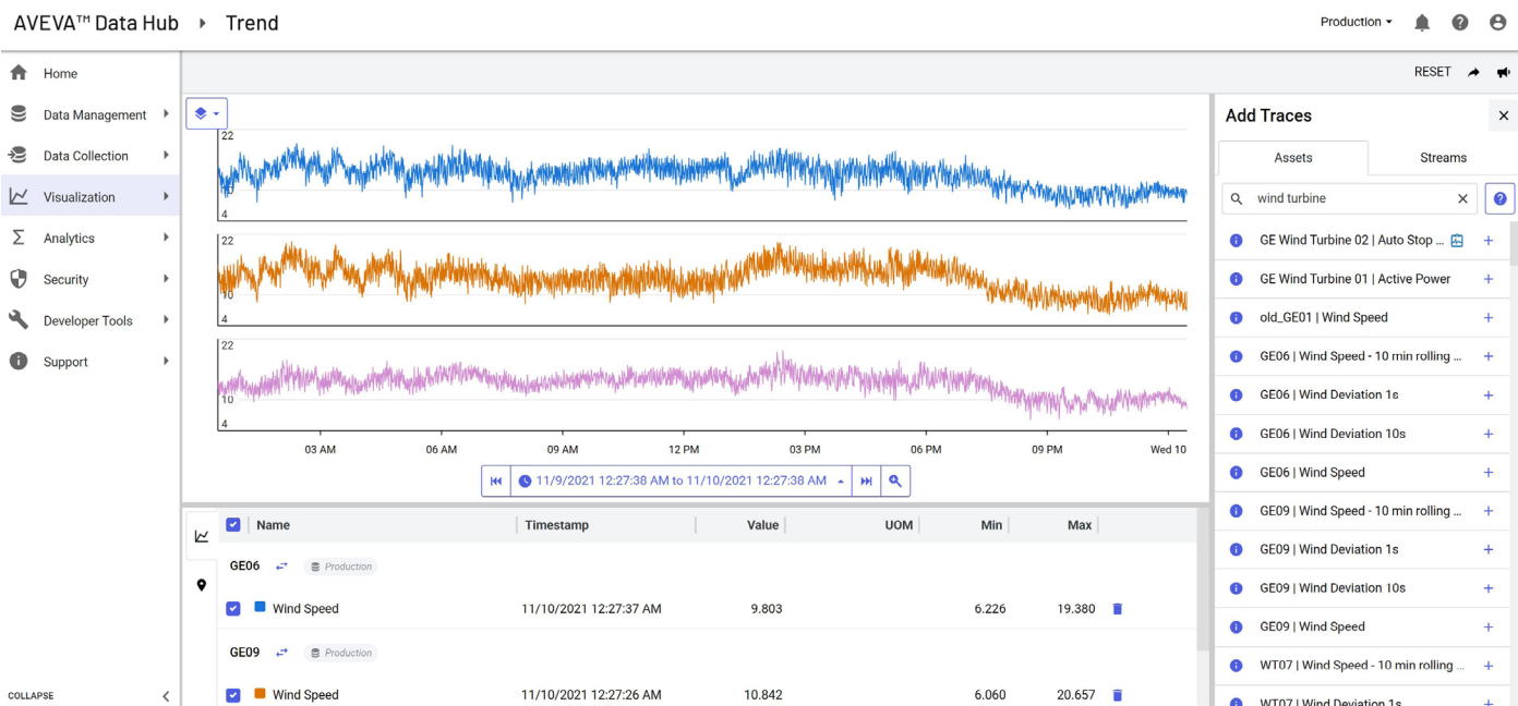
Obrázek: Zobrazení časových trendů výkonnosti v AVEVA Data Hub.